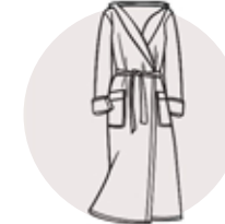
Халат, домашняя одежда